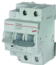
Fotografía no vinculante