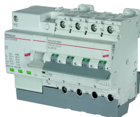
Fotografía no vinculante