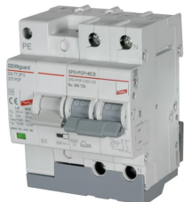
Fotografía no vinculante